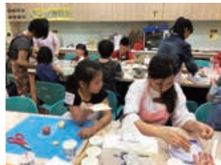
親子協力合作烤餅乾

後的正向改變。課程中亦安排有獎徵答，成員們皆能踴躍回答並給予回饋，感受到成員有專心聆聽講師授課