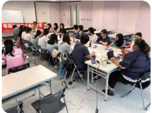
5月30日社工財金知能運用工作坊，社工督導、講師和社工們進行服務心得交流及督導。