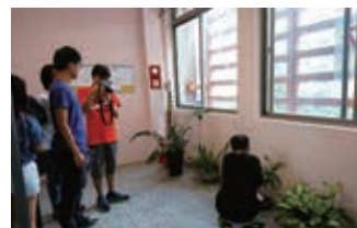
青少年在攝影課程中找到樂趣，並從中探索自我。

原本的陌生到相識，也透過團隊合作共同完成任務，彼此的情感產生連結，建立深厚的友誼。此外，除了基礎課程教學外，每位講師豐富的人生故事也帶給學員們不一樣的啟發。在最後分享的過程中，學員產生自我認同感並更加欣賞自我，也看到自身可進步的空間，對於往後的學習及發展都會是莫大的幫助。