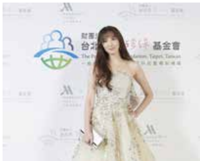
慈善大使吳佩慈愛心支持不落人後。