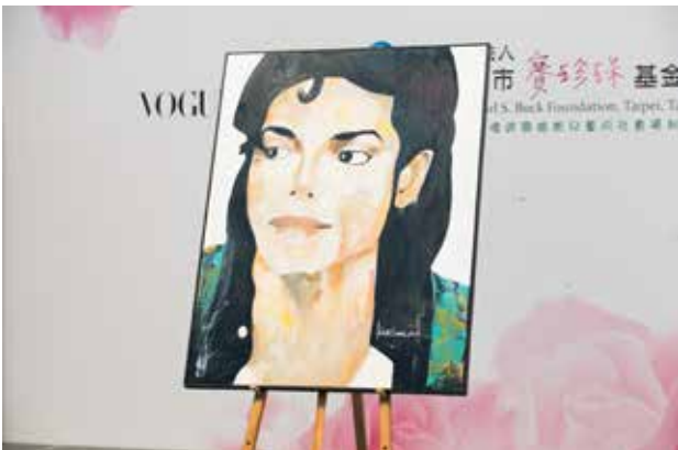
藝人郭彥甫捐助畫作拍賣。