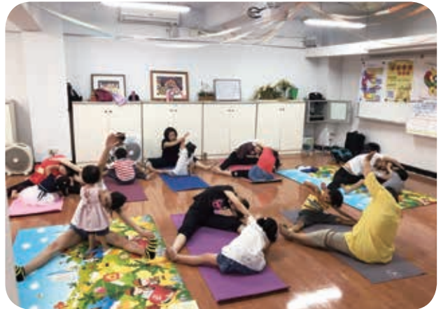
5月19日北區據點於臺北市家庭教育中心辦理「活力一起動起來～親子有氧瑜珈」，使親子增進彼此感情。