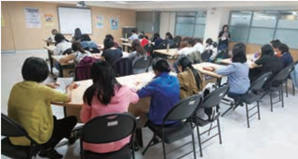
通譯人員培力課程實況。

擔任會館通譯人員時，曾接待來萬華新移民會館參觀訪問的國外媒體雜誌記者，其中包含馬來西亞、菲律賓、印度、紐西蘭。當天我主要提供現場通譯之服務，負責翻譯民政局股長和專員的臺北市新移民輔導措施簡報。所有來賓一致讚許臺北市對移民的完善照顧可媲美先進大國。個人完全贊同他們