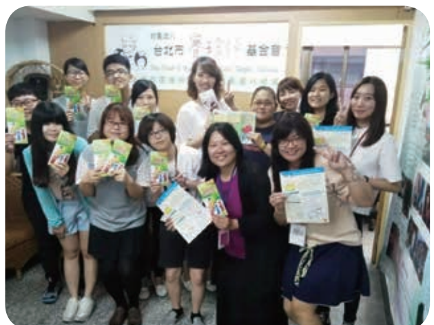
6月29日士林北投區早期療育社區資源中心人員參訪，與本會社工交流服務心得。