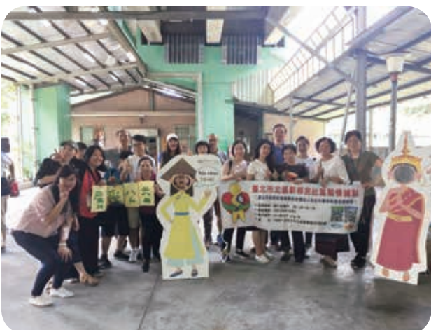
6月9日北區據點、葫東區民活動中心辦理「葫東心 新傳眾」活動，特別請新移民擔任「展珍新-愛公益」志工大使。