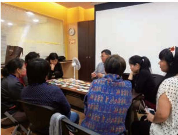
利用玩遊戲方式學習，新移民媽媽都樂在其中。

本會期待給予我們服務對象即使只是現階段一些微小的改變，卻能像蝴蝶效應一般，帶動整體新移民家庭長期且巨大的效應。