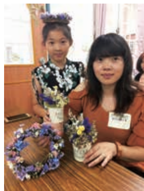
親子共同打造新力量

承續往年辦理手作課程經驗，故今年規劃連續性課程，讓所有成員可以身心放鬆之餘還學會實用技能，不僅可在職場上發揮，也可以為居家環境點妝新色彩！