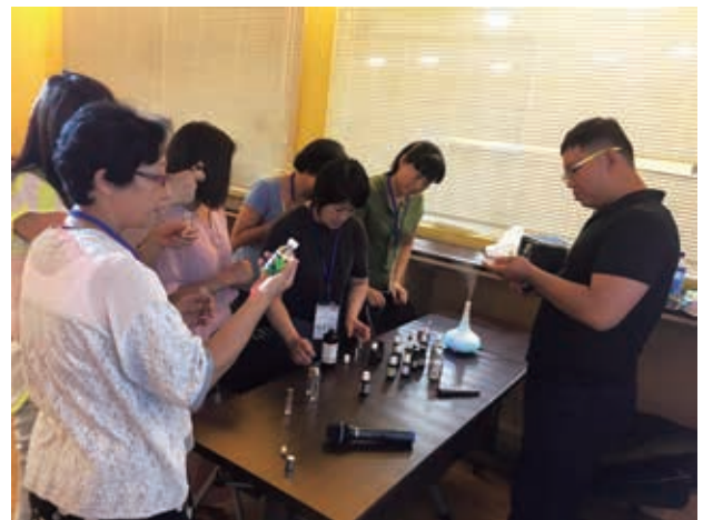
新移民媽媽學習使用精油，以適時的放鬆自己。