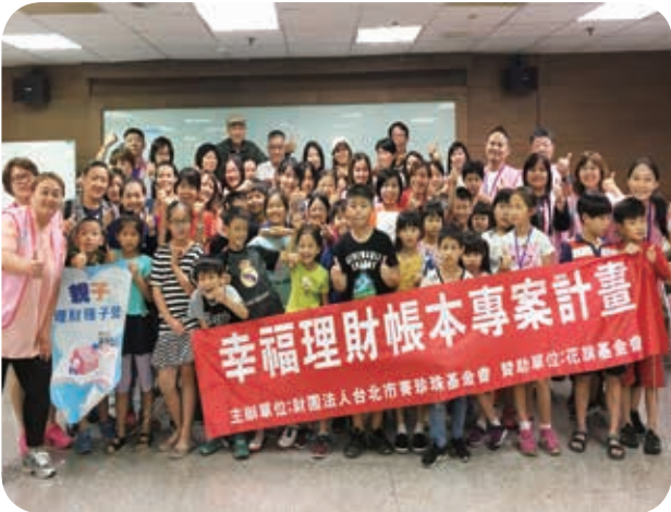
5月26日本會與桃園市政府社會局合辦親子理財種子營，學員收穫滿滿、開心結業。